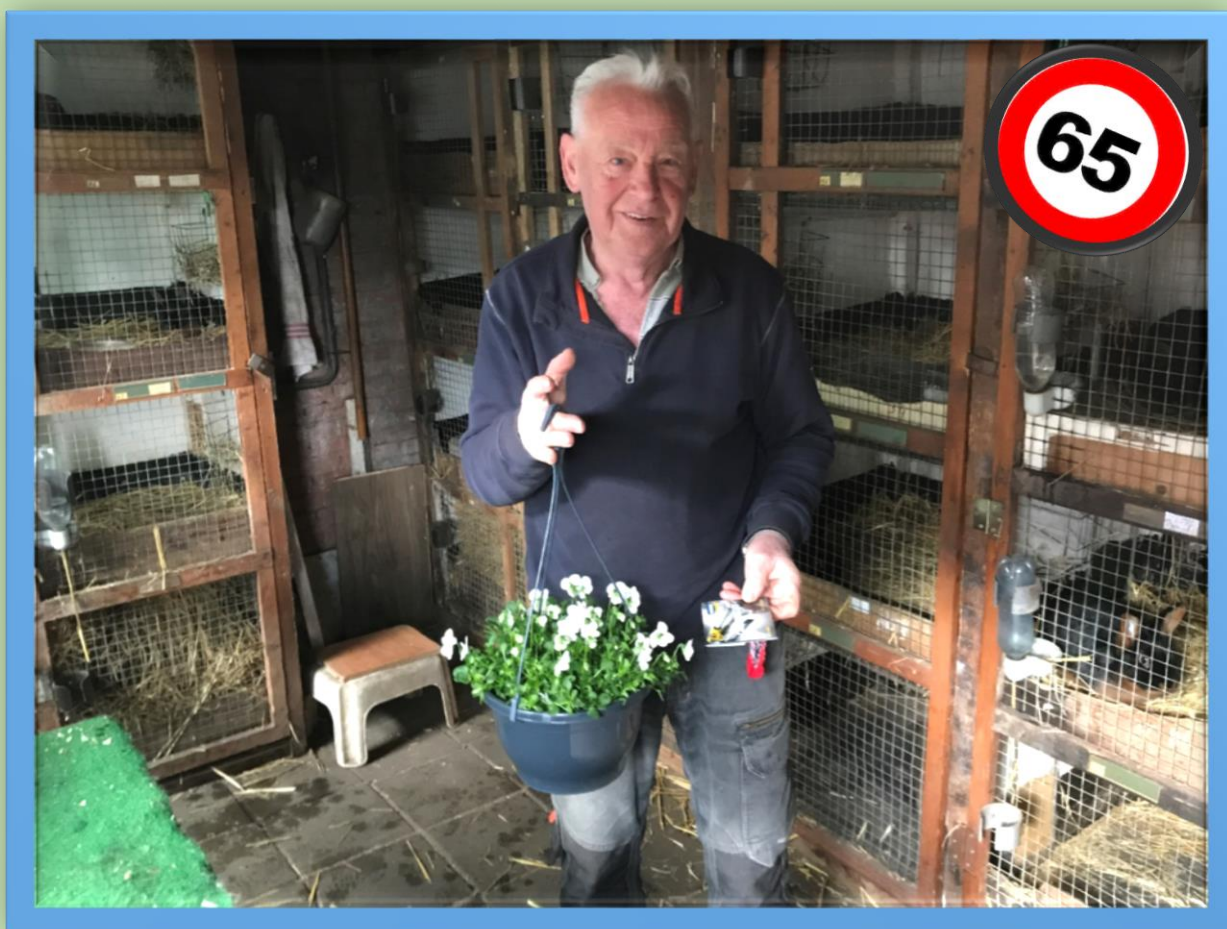
H.S Commies bij zijn zwarte Tans

Namens het bestuur, van harte gefeliciteerd met deze mijlpaal.